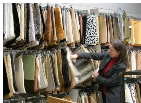
数百種類に及ぶ生地サンプル