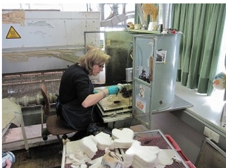
スプレーで模様付けする職人

また製品は最高の品質と信頼できる安全性でも有名です。素材、加工、環境への配慮、そして玩具としての価値と全てに渡り、一般的基準を大きく超えて管理されています。毒性のない色素を使用し、ヨーロッパ製の布地を使い、難燃性で、その多くが洗濯できる素材です。