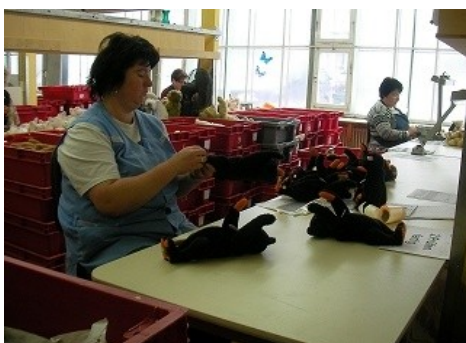
仕上がりを厳しく検品