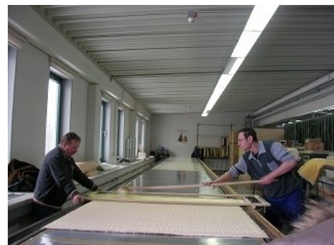
生地に模様をペイントする作業